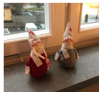
Tomteparet som vaktar gästlägenheten ☺

Trevlig fortsättning på december önskar Styrelsen