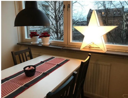
Köket i gästlägenheten